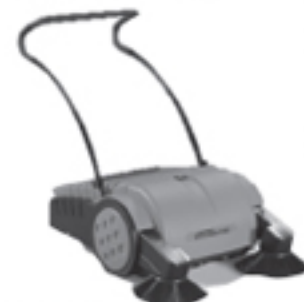
③MTX 900 清掃面積2000m 2 /h