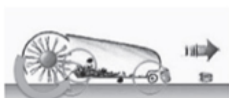
図1 シングルローラー

では、ツインローラーシステム(TRS)について簡単に説明させていただきます。(図3)高さの違うローラーブラシがそれぞれ逆回転することによりブラシとブラシの間が真空状態になり回収力が大幅にアップする、また、高さが違うため、つぶれた空き缶、木片などきつちり回収します。また、弊社スワイパーのボディは、ポリエチレン樹脂からなり、100%エコリサイクル可能な商品です。デモ機もご用意致しておりますので、お気軽にお声かけ下さい。お待ちしております。