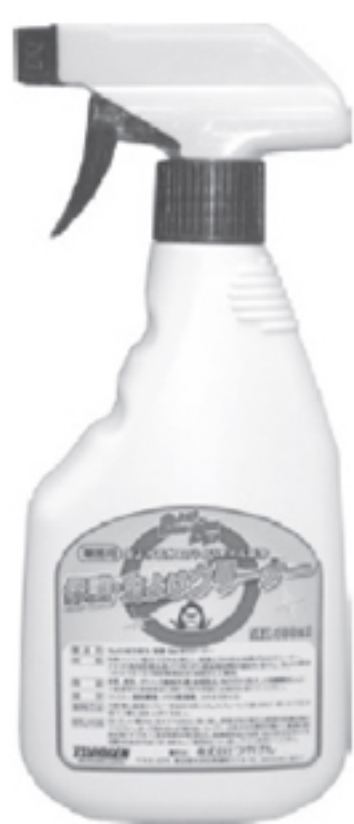
保護虫よけクリーナー 500ml×20本入り 500ml×20本入り

害虫対策として、お客様への新しい作業提案として一度虫よけBAN・BANシリーズをお試し頂いては如何でしょうか？