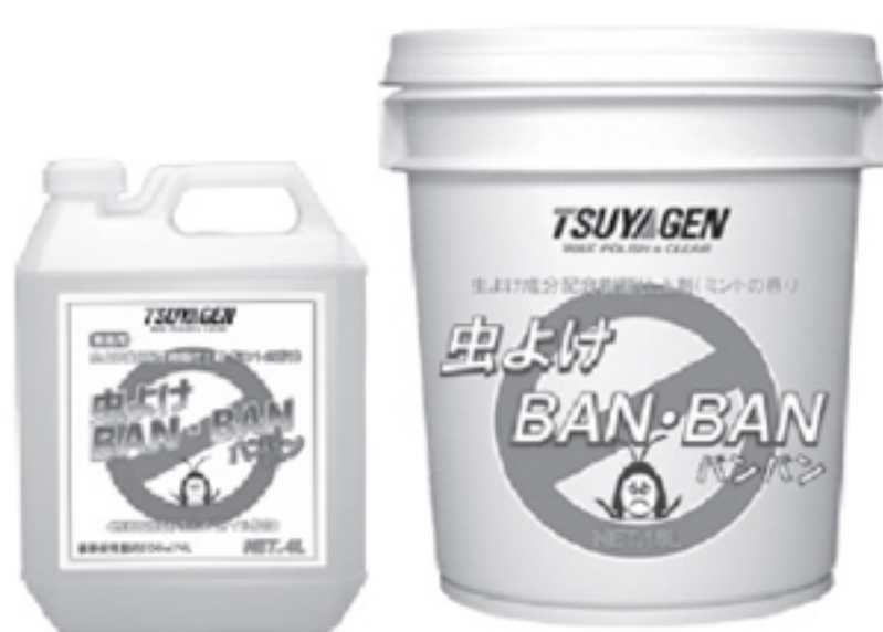
虫よけBAN・BAN 18L/4L×4本入り 標準使用量約1,400㎡(18L)