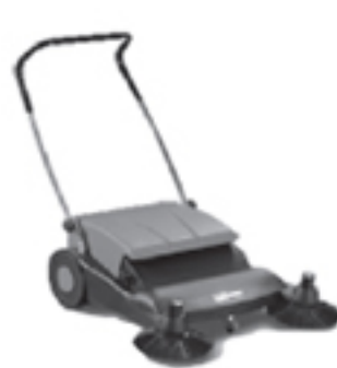
②TWINNER 650 清掃面積1000m 2 /h