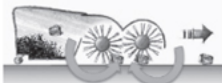
図2 TRSツインローラーシステム