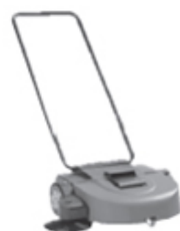
①TWIN TRIIX 650 清掃面積500m 2 /h

スワイパーの回収方法には、図1(シングルローラー)、図2(ツインローラー)の2種類があります。TWIN TRIIX 650は図1の方式でありますが、それ以外のスワイパーは図2の方式を採用しております。