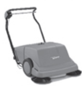
④KSE 900 清掃面積2500m 2 /h

では、ツインローラーシステム(TRS)について簡単に説明させていただきます。(図3)高さの違うローラーブラシがそれぞれ逆回転することによりブラシとブラシの間が真空状態になり回収力が大幅にアップする、また、高さが違うため、つぶれた空き缶、木片などきつちり回収します。また、弊社スワイパーのボディは、ポリエチレン樹脂からなり、100%エコリサイクル可能な商品です。デモ機もご用意致しておりますので、お気軽にお声かけ下さい。お待ちしております。